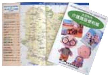
市内介護施設のガイドマップ

青春映画館上映については、機材整備はできたのですが、上映には、クリアしなければならぬ問題が多くありました。70歳～80歳の高齢者が個人でビデオレンタルショップに行き個人で楽しむのは良いのですが、何人が集まって映画上映といったスタイルは無料であっても著作権法違反になるとのことでした。映画配給会社へ足を運び、何度もやりとりを行い、やっとのことので了解を得ることができました。