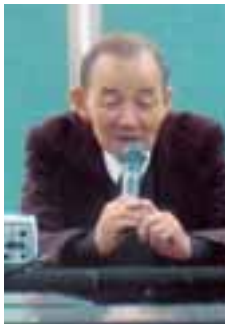
映画上映「ふみ子の海」