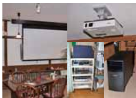
青春映画館上映機材

しかし、日頃からの自分のやりたいことや訴えたい思いを持っているならば、こうしたチャンスを是非活かしてみたいかがでしょうか。