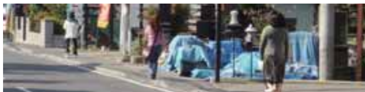
訓練の様子 (一番右が徘徊役)

所在不明者の捜索は、警察署が窓口となり、二十四時間体制で対応し、ネットワーク協力団体・企業・登録者等へ一斉ファックス・一斉メールで情報提供し、発見された場合も同様