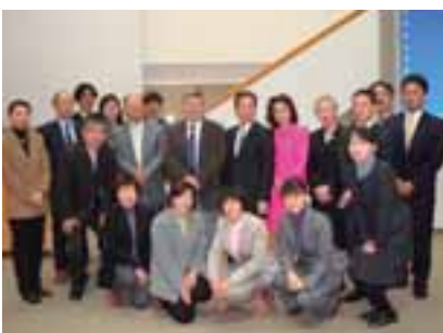
フィンランド・社会保険庁事務所にて