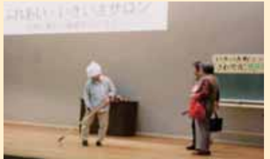
「サロンに来てみませんか？」