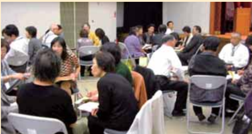
「うちのサロンはこんなことやってるよ」

・参加者の固定化、本当に参加して欲しい人に参加してもらえない。 ・担い手が少ない。 ・区長やボランティアの協力が得られない地域がある。 いかに協力者になつてもらおうか。 ・回覧板は見ない人が多い。個人あての通知や声掛けが有効。