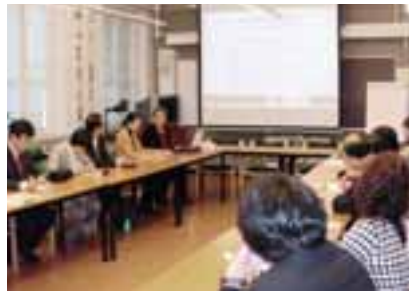
フィンランド・オーラインステイテュートにて

社会保険庁事務所では、いわゆる北欧型の「高福祉・高負担」(国民が充実した福祉を享受するため、高い税金等負担すること)であるフィンランドの社会保障制度について学びました。国家・地方自治体による教育・医療・社会福祉分野の取り組みの中で、予算配分競争があり、教育・医療に関する予算が優先され、社会福祉、とりわけ高齢者福祉分野に対する予算を少なくしようとする考え方があるとの説明は印象的でありました。