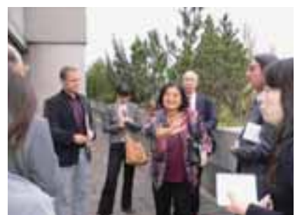
ドイツ・老人ホーム(AWO)にて

ドイツの介護保険と医療保険は一体とのこと、やはり、在宅重視の考えであり、(ドイツでは家庭での介護者にも介護手当を支給している。)利用者が住