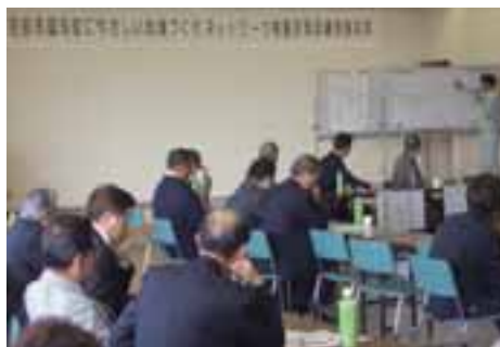
訓練の報告会・反省会

に送信される仕組みが構築された。また、地元FM OZEの協力により、放送中の番組を中絶し情報を提供している。