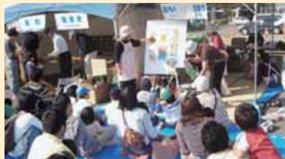
ふれあい広場より

来年度は、吾妻ブロックでの開催を予定しており、地域の特性を活かしながら、一層の地域ボランティア・市民活動の振興の一助として参りたい。