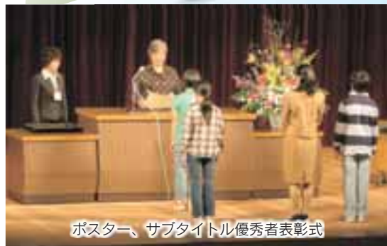
ポスター、サブタイトル優秀者表彰式