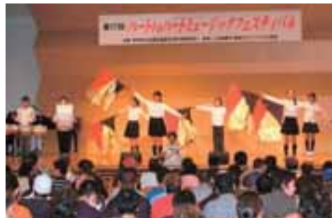
高崎北小学校6年生

本フェスティバルは県社協厚生事業部会の施設・団体の職員代表による実行委員会形式で企画・実施されています。実行委員は日々支援業務を抱えながら、会場の調整や出演者との交渉等々を行い、準備を進めてきました。その中でスタッフ全員の思いは、良い音楽を施設の利用者に聴いてもらいたい、そしてそれが、利用者の社会参加や心の潤いに繋がって欲しいというものでした。