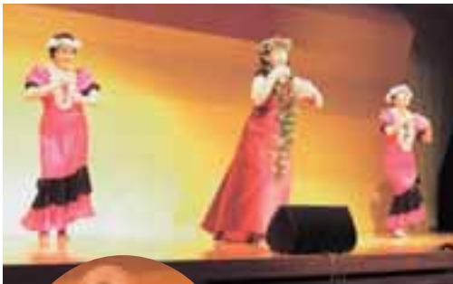
ふれあいバラエティグループ

障害の有無や出身、信条にこだわるのではなく、お互いの違いを認め合い、ともに生きることのできる心を持ちたいという願いを音楽に託し、明るい社会づくりに寄与していく。』ことを目的として開催されています。