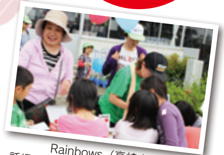
Rainbows (高崎市) 託児ボランティア、外国人家庭支援 防災活動など