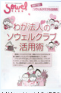
わが法人のソウエルクラブ活用術

ソウエルクラブに寄せられる声で最も多いご意見は、職員一人あたり毎年一万円の掛金が高いといったことです。今回は、先日、福利厚生センターで発行された「わが法人のソウエルクラブ活用術」をもとに福利厚生事業について考えてみましょう。