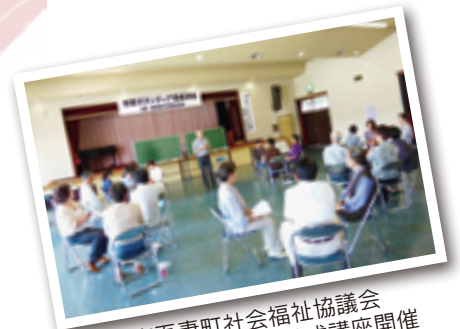
東吾妻町社会福祉協議会 傾聴ボランティア養成講座開催

更に詳しい募金の使い途は「赤い羽根データベースはねっと」へ>>> http://hanett.akaihane.or.jp/hanett/pub/home.do