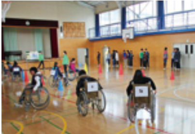
福祉体験教室の様子