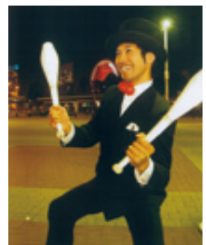
マジヤシャン 若鳩