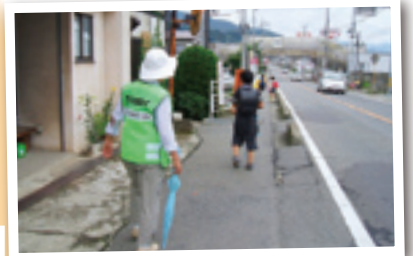
みなかみ町老人クラブ連合会 月夜野支部 (みなかみ町) 安全支援隊 ベスト購入