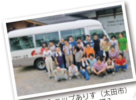
ワークショップありす (太田市) 利用者送迎用車輛購入

群馬県では65年目となる 共同募金運動 が、10月1日から始まります。赤い羽根に協力してくださったみなさまのやさしさは、大きな力となつて、みなさまの町の福祉を応援してくれています。今年もご理解・ご協力をお願いします。