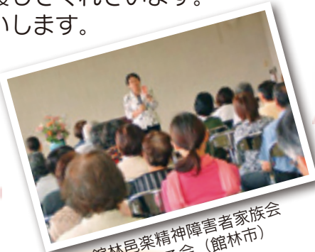
館林音楽精神障害者家族会 たけのこ会 (館林市) 講演会開催