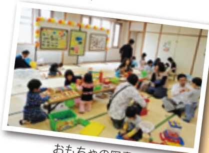
おもちゃの図書館 あそびの広場 (渋川市) 療育活動ボランティア

※共同募金は、必要とされる金額をその年の目標額とする「計画募金」です。これは、寄付を公平に配分するための方法として、社会福祉法に定められています。