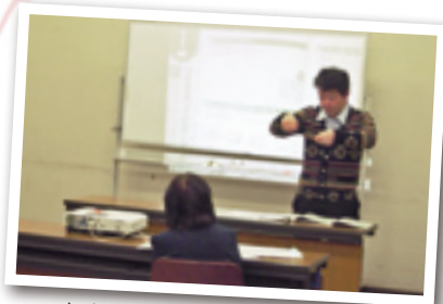
中之条町聴覚障害者福祉協会 手話講習会などで使用する プロジェクター関連機器購入