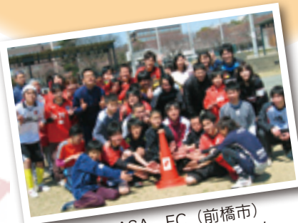
TSUBASA FC (前橋市) 知的障害児者サッカーチーム イベント開催