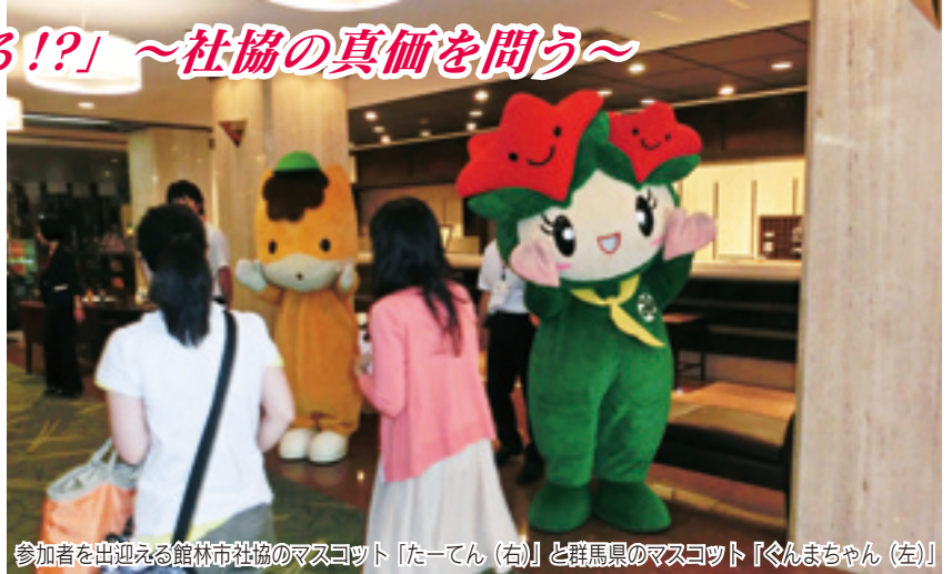
参加者を出迎える館林市社協のマスコット「たーてん(右)」と群馬県のマスコット「ぐんまちゃん(左)」

平成24年7月19日(木)・20日(金)の両日、水上温泉を会場に第49回関東ブロック郡市区町村社協職員合同研究協議会が開催された。東日本大震災から1年4カ月が経過し、復興に向け社協は何かできるのか、人と人との繋がりや支え合いを進める社協の真価が改めて問われている中での研究協議会の開催である。