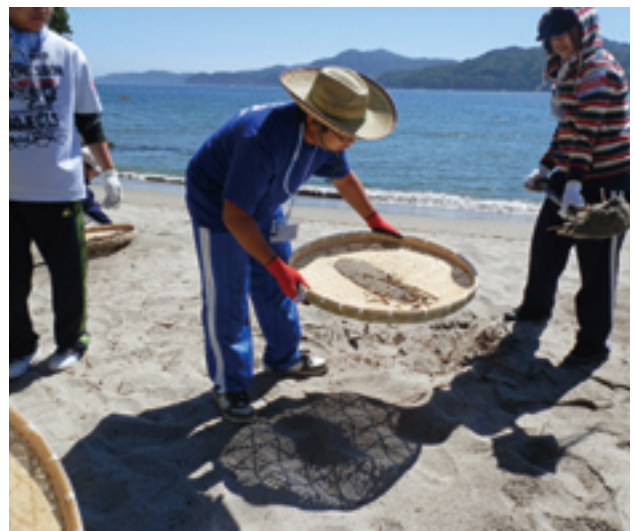
新たなビーチづくりへ

ボランティアセンターによる隙間ニーズへの迅速な対応、支援ニーズに対応する新たな福祉サービスの企画・開発機能を包括してすすめるセンター事業は、外部の支援ともしっかりとつながって、被災地を支えています。こうした私たちにとって希望の糧とは、日本全国からの救援・支援活動でした。どこかで私たちのために祈ってくれる人がいる、応援して下さる人がいる、こうした思いを受け止め、深い悲しみから目をそらさず、少しずつではありますが前を向き始めることができていると思います。群馬の皆様にも本当にたくさんのご支援を頂戴しました。こうした“つながり”を大切に、普通の暮らしを1日も早く取り戻したいと思っています。これからもご支援よろしくお願ひします。