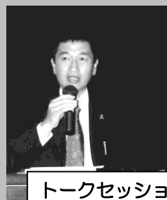
トークセッション講師