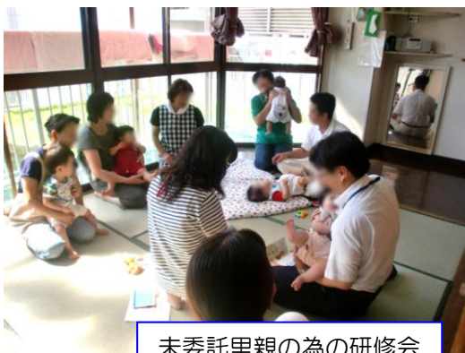
未委託里親の為の研修会