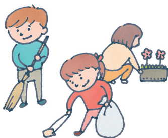
せいそう 清掃活動