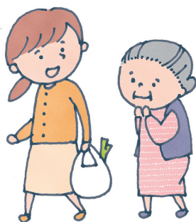
よ お年寄りの荷物を 持ってあげる