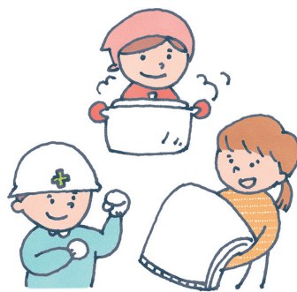
さいがい 災害ボランティア がれき てつきよ 瓦礫の撤去