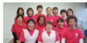
指導者を囲むトレーナーの仲間たち