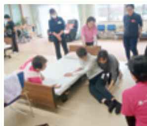
出前講座の様子（床からの起き上がり）

在宅介護の最前線で多様なニーズに対応していくた め、資質向上を目指した研修、情報提供、相談事業、ネッ トワークの拡大等への取り組み、また、誰もが適切に できる介護技術を、地域に伝えていくため、独自に「ト レーナー制度」を設けその定着に努めております。