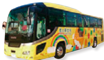
福祉バス「愛の募金号」