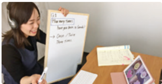
「まなばる」オンライン授業の様子