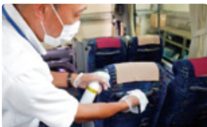
利用後には車内消毒を実施