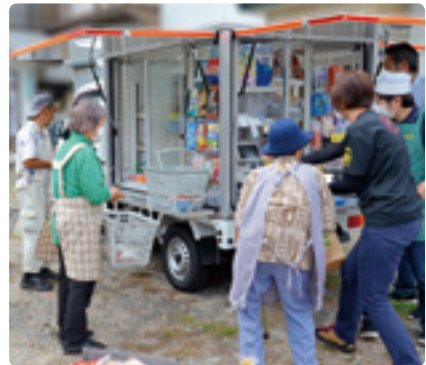
24時間テレビ寄贈の移動販売車