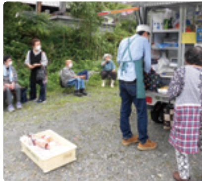
待っている時間がサロンに