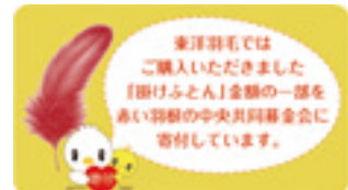
東洋羽毛公式キャラクター ピヨ丸

私たち東洋羽毛は、1950年に共同募金のシンボルである赤い羽根の考案に参画し、原料を供給したことをきっかけに創業しました。その頃より、保温材としての羽毛の優れた機能に着目。東洋羽毛の良質の羽毛は、なんと羽毛服やシュラフとして、南極観測隊とともに厳寒の地でも大活躍。以来、東洋羽毛は羽毛の温かさ、気持ちよさを皆様にかけて欲しいと願い、高品質な羽毛ふとんをつくり続け今年で67周年を迎えました。