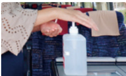
乗車時には手指消毒を実施