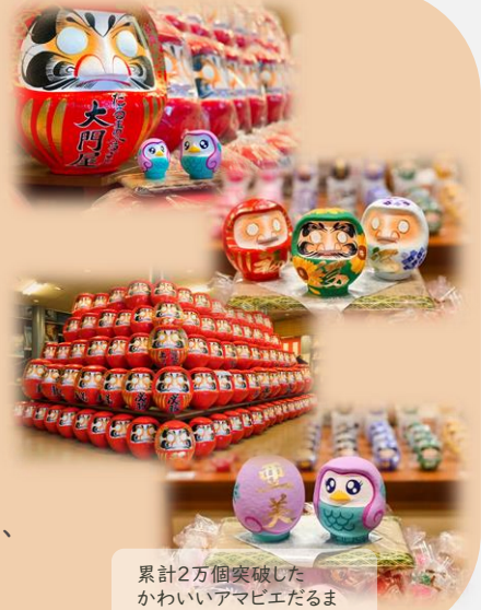
累計2万個突破した かわいいアマビエだるま

ご来店のお客様には、伝統の意味がちゃんと込められている、 素敵なお福分けプレゼント有！ 約140平米の店内で安全に楽しく思い出の品を！