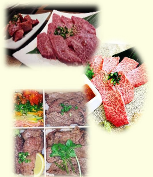
※写真はイメージです